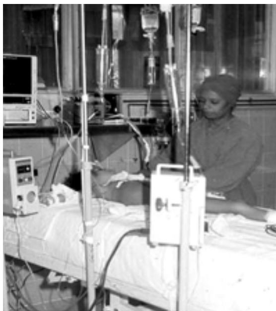
Fig. 6. Paciente pediátrico ventilado y monitorizado. Sala de Terapia Intensiva. Hospital "William Soler" (1982).

y Pan América en 14 años de trabajo, el 1,38 % de los ingresos del hospital fueron en esa unidad y el 9,34 % de los fallecidos fueron en la Terapia Intensiva. La mortalidad en UTIP fue de un 19,9 %.