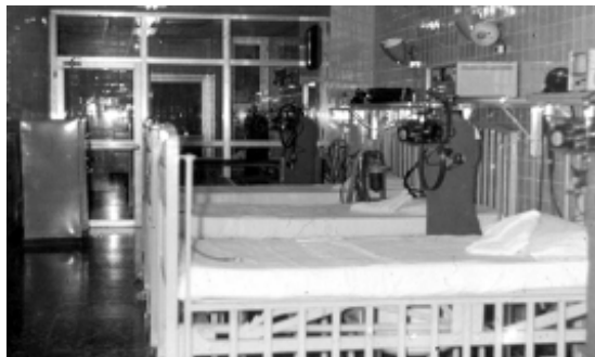
Fig. 2. Sala de Terapia Intensiva Pediátrica Hospital "William Soler" (1967).

Esta sala se creó en un local que era del sindicato y que fue donado por la dirección del mismo, para tan encomiable menester, las camas, de inicio 5, se trajeron del Hospital "Manuel Fajardo" el cual había desactivado el servicio de pediatría, el salón de operaciones donó 2 monitores, uno cardiorrespiratorio y otro de EEG y un ventilador Mark VII, que existía en el almacén para otros menesteres de la provincia y que nuestro director lo asignó para esta sala (figs. 4 y 5).