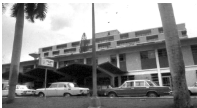
Fig. 1. Hospital "William Soler" de La Habana, Cuba.

En 1967 regresé al Hospital "William Soler," donde se encontraba de director el antes nombrado doctor y con el cual analizamos lo ya planteado, haciéndole las modificaciones que entendíamos necesarias dadas nuestras realidades. El 25 de noviembre se inauguró lo que sería la primera sala de Cuidados Intensivos de nuestro país y la primera pediátrica de toda Iberoamérica y Pan América, si tenemos en cuenta, que la primera pediátrica de los Estados Unidos se creó en el año 1968 (figs. 1, 2 y 3).