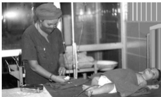
Fig. 4. Paciente atendido en la Sala de Terapia Intensiva Hospital "William Soler" (1967).

En el año 1968, las enfermeras y el personal comenzó a recibir, impartido por nosotros, todo el entrenamiento y el aprendizaje de la forma de trabajar en este tipo de servicio, para niños críticos, se reduce por un problema de espacio de 5 a 4 camas la dotación.