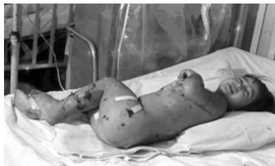
Fig. 5. Paciente pediátrica críticamente enferma. Sala de Terapia Intensiva. Hospital "William Soler" (1967).

En 1972 se dio el primer curso provincial de Cuidados Intensivos, en este caso pediátrico. Se inauguraron la sala de Cuidados Intensivos del Hospital Pediátrico "Pedro Borrás" y la sala de Cuidados Intensivos de adultos, primera de su tipo en Cuba, del Hospital "Calixto García". También la sala de de Cuidados Intensivos del Hospital Pediátrico de Santa Clara.