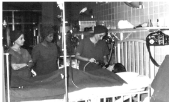
Fig. 3. Paciente atendida en la Sala de Terapia Intensiva Hospital "William Soler" (1967).