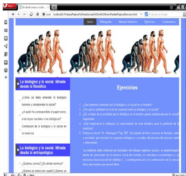
Fig. 4. Módulo Ejercicios