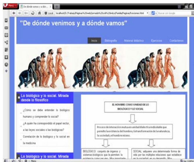
Fig. 2. ¿Cómo se debe entender lo biológico humano y comprender lo social?